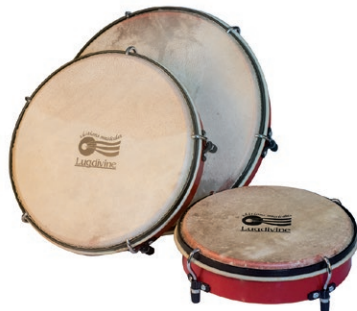
Lot de 3 tambourins de sol (Lugdivine)