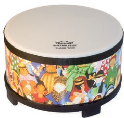
Floor tom (Remo)