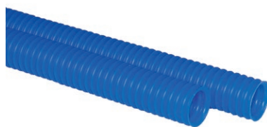
Tuyaux harmoniques « Haute qualité » (Lugdivine)