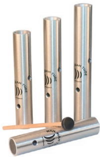
Wah wah tube (Schlagwerk)