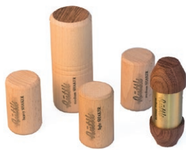
Lot de 12 shaker bois et métal (Rüttli) ou à l'unité (photos de quelques-uns)