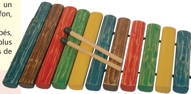
Balafon 2 octaves (Robert Hébrard)