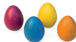
Petits œufs maracas en plastique