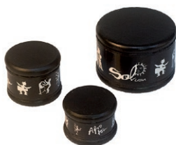
Shakers-parleur - 3 tailles