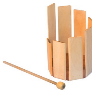
Octoblock (à poser au sol)