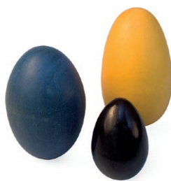
Gros œufs maracas en bois