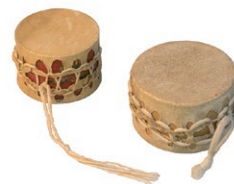
Shakers-parleur (JP Minchin)