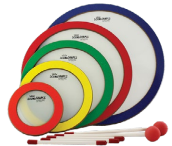
Sound Shapes Circle (Remo)